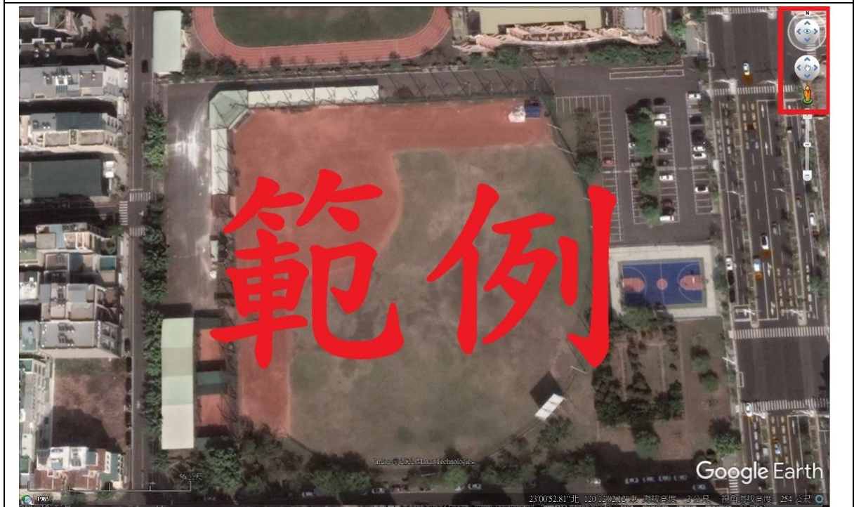
圖 2、空拍圖 (請使用 Google Earth Pro，並於右上角附上球場座向標示)