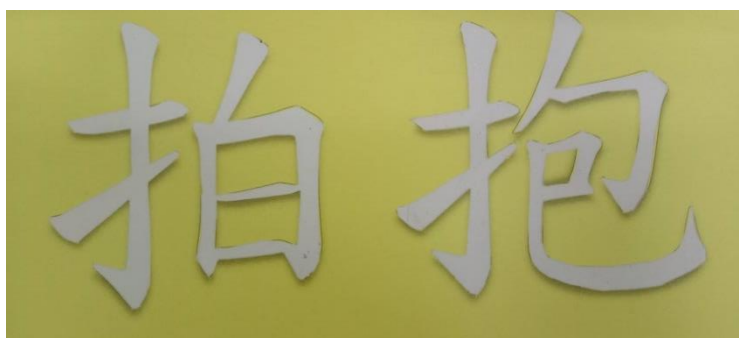
成品，此頁是「黃紙配白砂」。