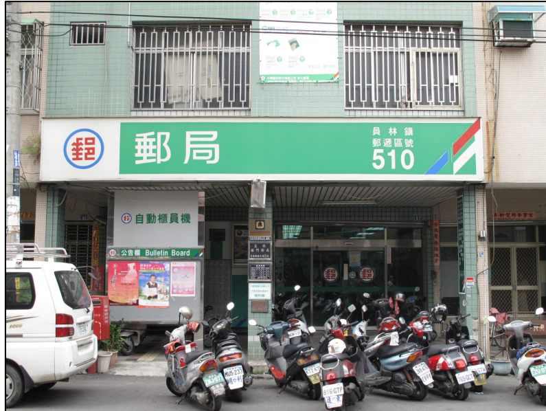
↑ 員林鎮西門郵局分局