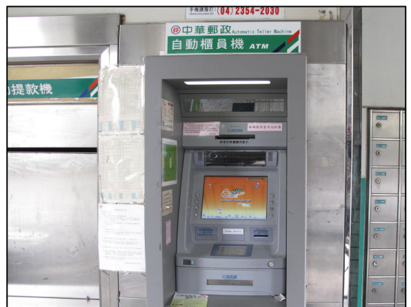
↑ 提款機提供領錢及轉帳服務