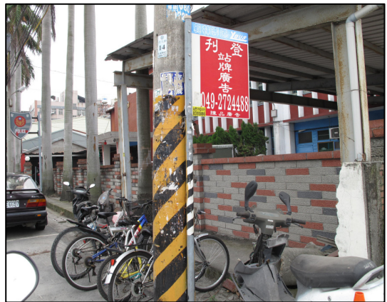
↑ 公 ㄩ 車 ㄩ 站 ㄩ 牌 ㄩ

要 ㄩ 怎 ㄩ 樣 ㄩ 知 ㄩ 道 ㄩ 社 ㄩ 區 ㄩ 還 ㄩ 有 ㄩ 其 ㄩ 它 ㄩ 的 ㄩ 資 ㄩ 源 ㄩ 可 ㄩ 以 ㄩ 利 ㄩ 用 ㄩ 呢 ㄩ ？