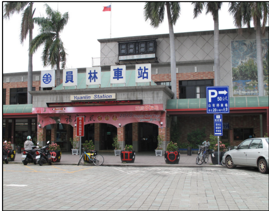
↑ 員 ㄩ 林 ㄩ 火 ㄩ 車 ㄩ 站 ㄩ

如果 ㄩ 要 ㄩ 出 ㄩ 去 ㄩ 玩 ㄩ ，那 ㄩ 你 ㄩ 就 ㄩ 需 ㄩ 要 ㄩ 搭 ㄩ 乘 ㄩ 交 ㄩ 通 ㄩ 運 ㄩ 輸 ㄩ 的 ㄩ 工 ㄩ 具 ㄩ ，最 ㄩ 常 ㄩ 見 ㄩ 的 ㄩ 交 ㄩ 通 ㄩ 工 ㄩ 具 ㄩ 就 ㄩ 是 ㄩ 公 ㄩ 車 ㄩ 或 ㄩ 火 ㄩ 車 ㄩ 。