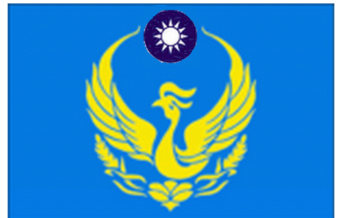
↑ 消 防 標 誌