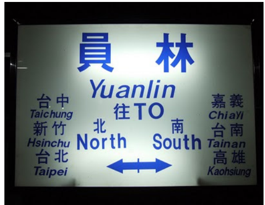
↑ 火 ㄩ 車 ㄩ 站 ㄩ 內 ㄩ 指 ㄩ 示 ㄩ 牌 ㄩ