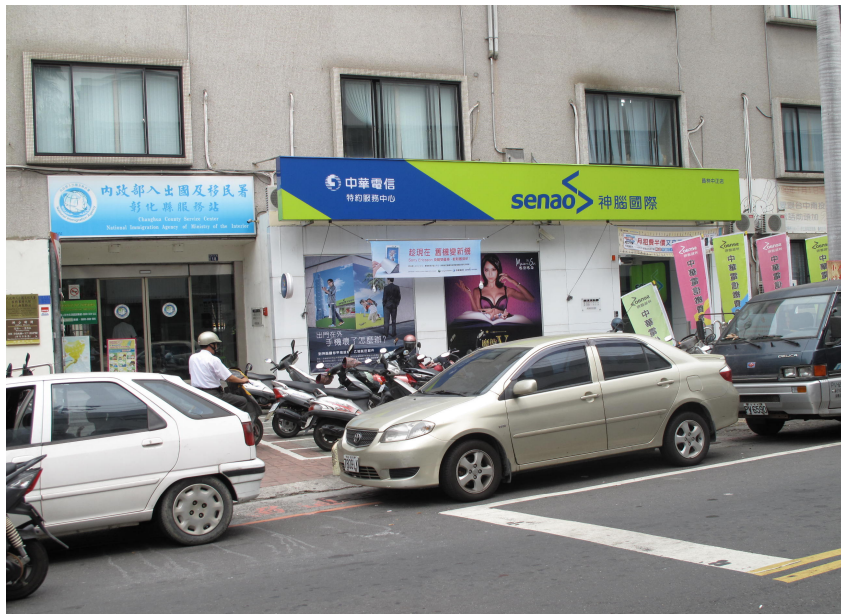
↑ 員 カ 林 カ 中 カ 正 カ 特 カ 約 カ 服 カ 務 カ 中 カ 心 カ

內 カ 電 カ 話 カ 、行 カ 動 カ 電 カ 話 カ 、網 カ 路 カ 服 カ 務 カ 。