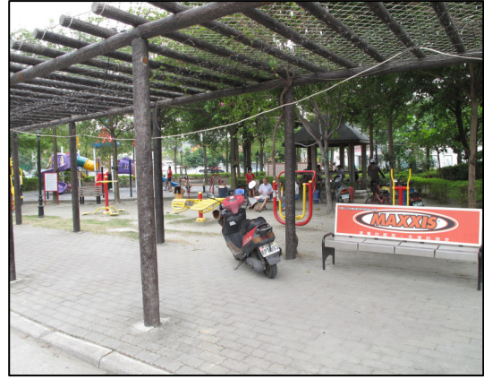
↑ 公園設施—運動器材