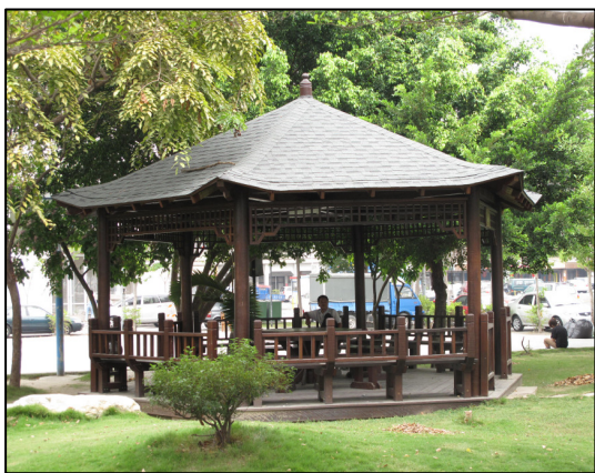
↑ 公 ノ 園 ノ 設 キ 施 ハ — 涼 カ 亭 カ

社 レ 區 ノ 公 ノ 園 ノ 裡 カ 面 ノ 常 キ 有 ニ 草 ノ 地 カ 、盪 ク 鞦 ク 鞆 ク 、溜 カ 滑 ク 梯 カ …等 カ 遊 ビ 樂 ク 設 キ 施 ハ ，提 テ 供 ク 民 ノ 眾 ニ 運 ビ 動 ス 跟 テ 休 ム 閒 ノ 用 ニ 。