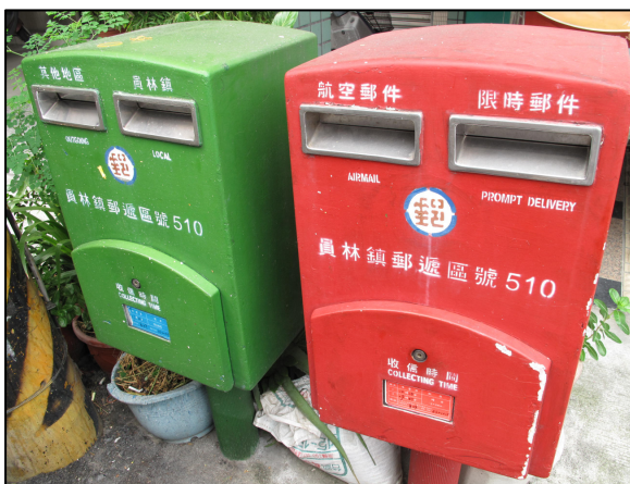
↑ 郵筒方便民眾寄信