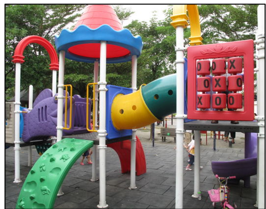
↑ 公 ノ 園 ノ 設 キ 施 ハ — 溜 カ 滑 ク 梯 カ