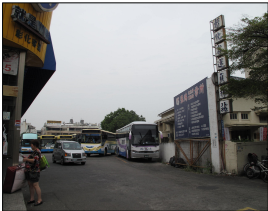
↑ 彰 ㄩ 化 ㄩ 客 ㄩ 運 ㄩ 員 ㄩ 林 ㄩ 站 ㄩ