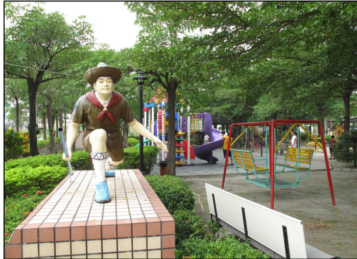
↑ 員 ノ 林 ノ 新 ノ 生 ノ 里 ノ 公 ノ 園 ノ

再 レ 來 カ ，社 レ 區 ノ 裡 カ 面 ノ 也 セ 會 レ 有 ニ 一 ニ 些 セ 場 ノ 地 カ 跟 テ 設 キ 施 ハ 是 ハ 給 フ 民 ノ 眾 ニ 休 ム 閒 ノ 及 テ 運 ビ 動 ス 的 ナ ，例 カ 如 ク 社 レ 區 ノ 公 ノ 園 ノ 、游 ビ 泳 ク 池 ハ …等 カ 。