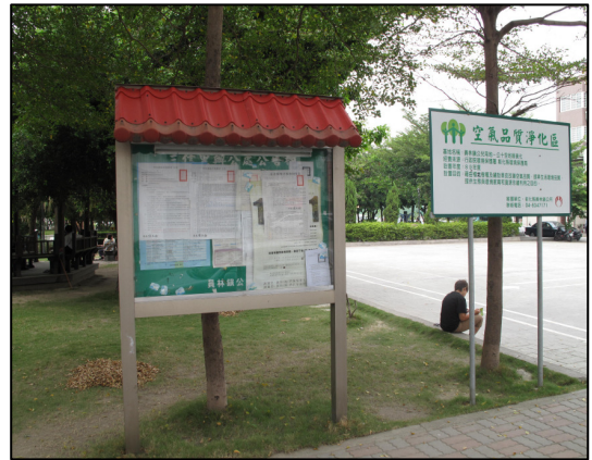
↑ 村里辦公室公告欄