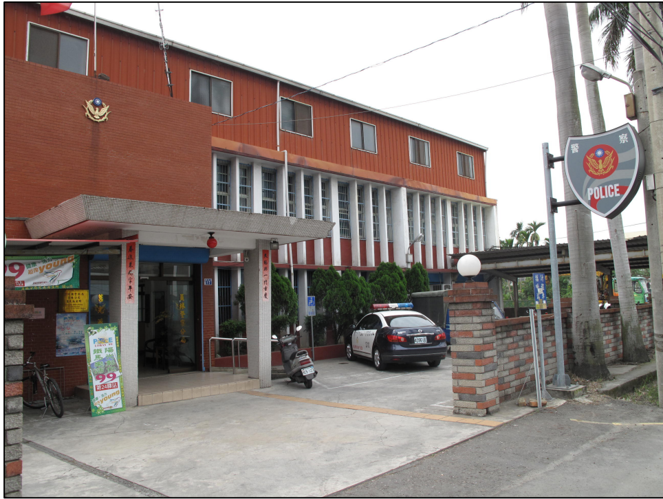
↑ 警 レ 察 レ 局 一 員 林 莒 光 派 務 出 所

當 カ 家 レ 裡 カ 有 人 病 重 需 要 緊 急 就 醫 ，發 生 火 災 或 有 毒 蛇 時 ア ，都 可 以 請 消 防 隊 幫 忙 。