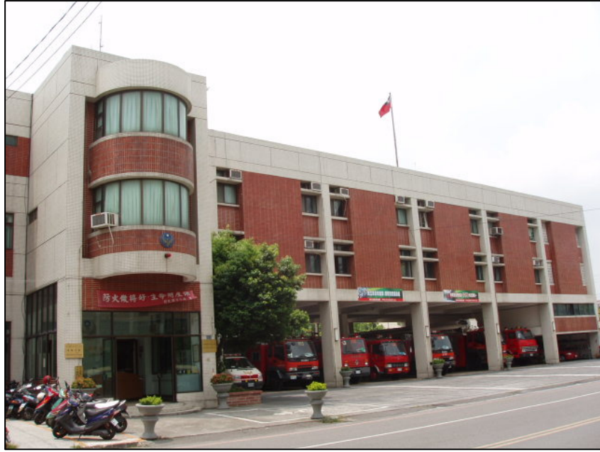
↑ 員 カ 林 カ 第 カ 二 カ 大 カ 隊 カ 消 カ 防 カ 分 カ 隊 カ