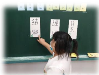
經由操作學習閱讀技巧