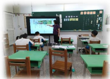
特教學生更容易專注學習