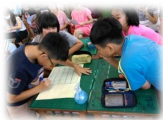
更容易掌握到學習重點