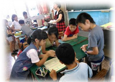
學生更容易參與分組學習

對普通班的學生而言，經由交互教學策略的運用，在學習過程中可以發現到自己學習的困難處，且在教師協助下利用策略來找到解決方案，因為找到了閱讀的方法，更容易讀懂課文，閱讀的速度可以有效提升。另一個正向的發現是學生可以經由學習單的提示，了解協助班上語文低就學生及特教需求學生的方法，在分組學習活動時更願主動擔任小老師，且能有步驟性的協助特教需求兒童閱讀和學習，而讓他們更容易參與分組學習的活動，並減少因為找不到重點或溝通不良而發生的課堂衝突，另一項意外的發現是普通班學生可以經由學習過程中，發現特教需求學生也可以經由他們的協助而有效參與學習活動並完成學習單，不只提升了雙方的學習動機，更慢慢建立起了友誼，讓特教需求學生在班上的學習或生活可以自然得到更多的支持。