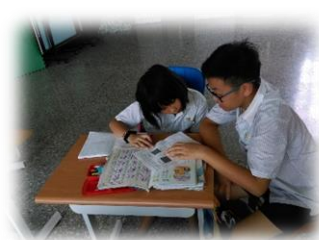
更願意協助特教需求學生

本套教材在特教需求學生或語文低成就學生的使用時，因為強調多樣性學習單的應用及練習，學生可以有較多的機會操作，且因為多次的接觸課文內容，自然而然的多次閱讀到課文，課文也較容易熟稔，且經由提問的引導，慢慢的學會了抓重點的策略，而讀懂課文。另一方面，為了完成學習單，學生需多次翻閱及抄寫課文中的語詞或句子，自然而然形成了過度練習，所以在促成學習理解是有明顯效果的。