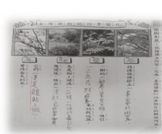
學習單完成品質提升

雖然因應特教學生的學習與需求，教師會在教材編輯時加入一些策略引導，像是圖像策略、關鍵字法、畫重點、六何法提問引導等．．．，但是不能否認的是特教需求學生的差異性極大，我們在使用這套教材時也會遇到問題，例如在心智圖使用上，對部份特殊需求學生而言是有著極大的困難的，經由多次使用與調整，我們也發現改用課文架構圖或結構圖反而有助輕度智能障礙學生學習，而概念構圖的使用反而更容易讓部份學習障礙學生掌握到課文中的學習重點，因此教師在使用本套教材時，仍需依學生的實際學習情況調整教學策略及學習單的內容，對學生的學習才會有更大的效果。