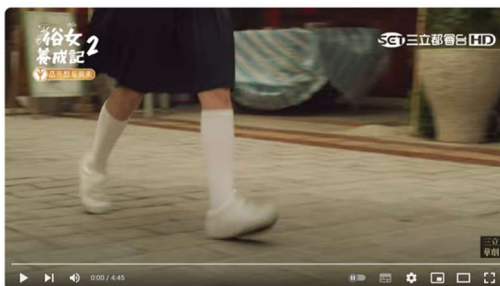
【俗女養成記2】EP2 嘉玲月經剛報到～被屁孩男同學笑！到疑似更年期～又被弟弟笑！精華【The Making of an Ordinary Woman 2】