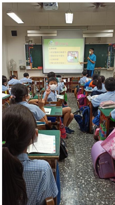
「藥」你知道—正確用藥