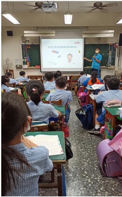
教師搭配繪本動畫描述 「城市游俠的神奇藥丸」 故事