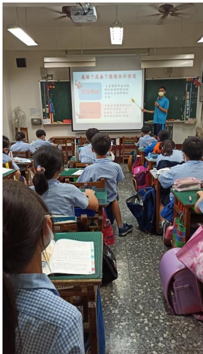
教師說明菸癮毒的危害