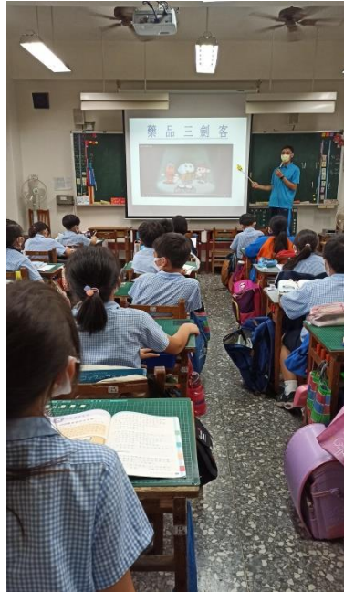
教師介紹藥品分為處方 藥、指示藥及成藥三級。