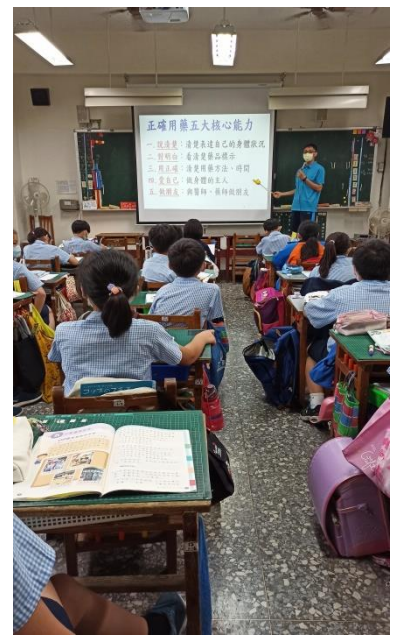
教師說明正確用藥五大核 心能力