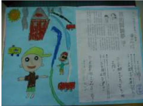
●夢想起飛（我的消防隊員夢）。