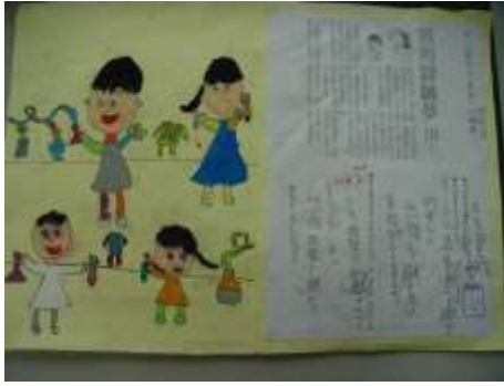
●夢想起飛（我的科學家夢）。