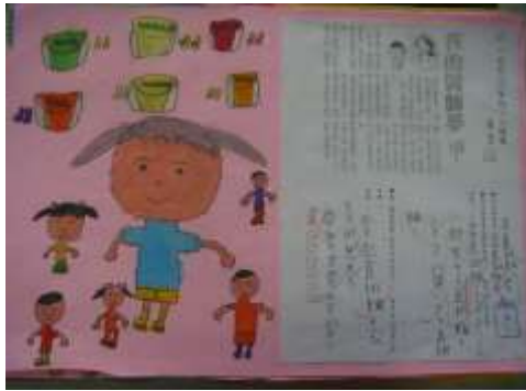
●夢想起飛（我的直排輪教練夢）。