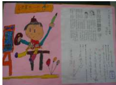
●夢想起飛（我的畫家夢）。