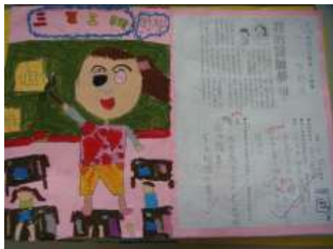
●夢想起飛（我的老師夢）。