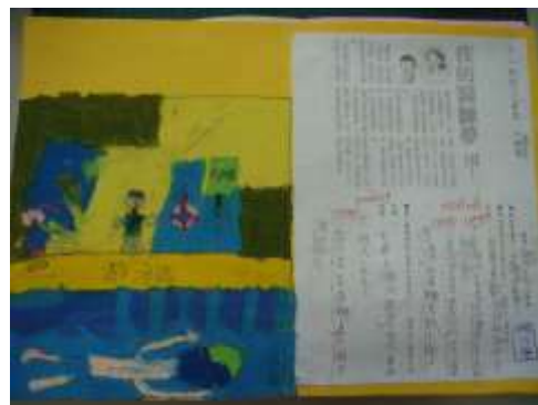
●夢想起飛（我的游泳教練夢）。