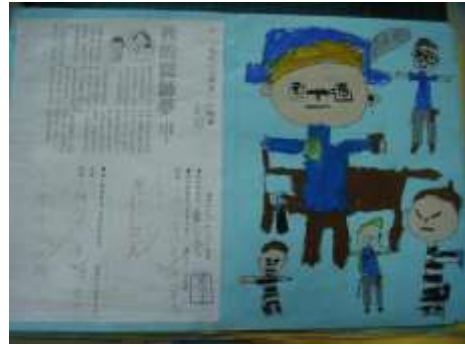
●夢想起飛（我的法官夢）。