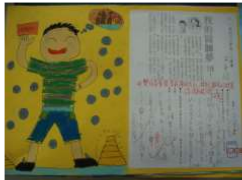
●夢想起飛（我的大富翁夢）。