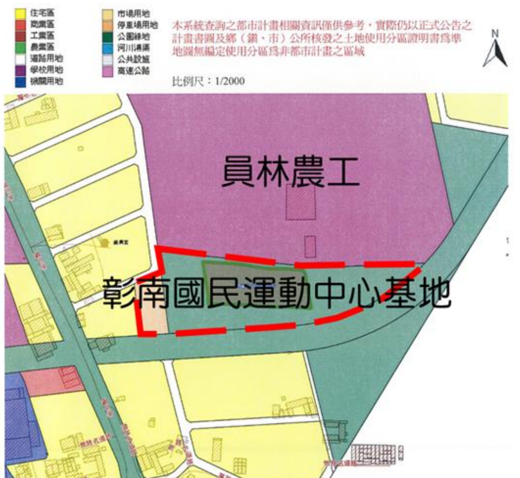
圖 1 本案彰南國民運動中心範圍示意圖