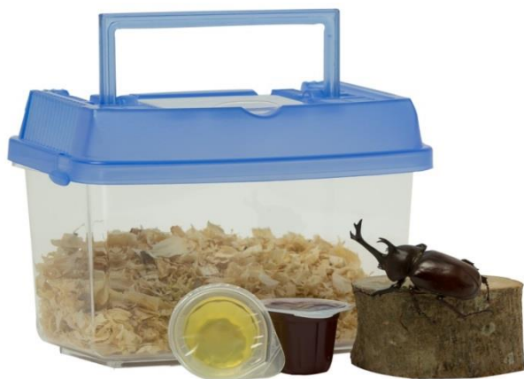
甲蟲飼養組(暑假贈品)