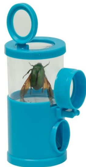
昆蟲放大觀察盒組