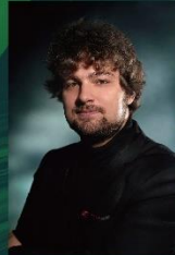
鋼琴 / 盧卡斯·金紐薩斯 Piano: Lukas Geniušas