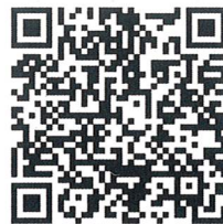
(夏日大作戰活動專屬頁面QRcode)